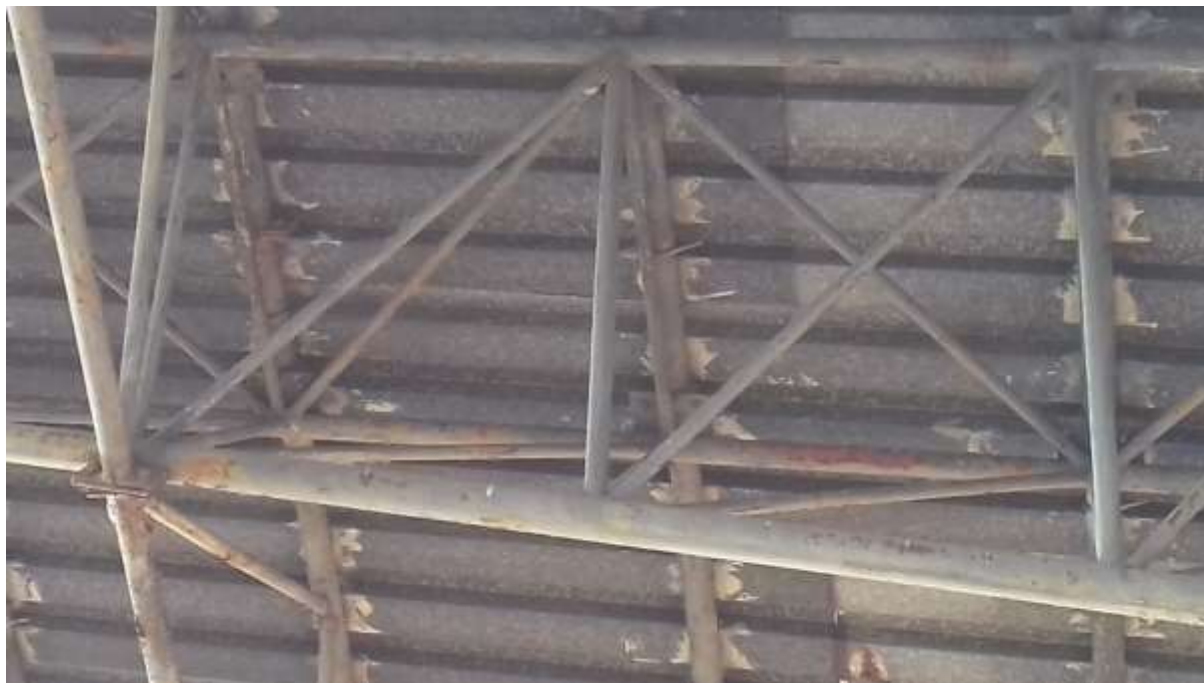
Obrázek č. 4 – ocelová konstrukce tribuny

Bude provedena oprava a nátěr střešní lávky (obrázek č. 7).