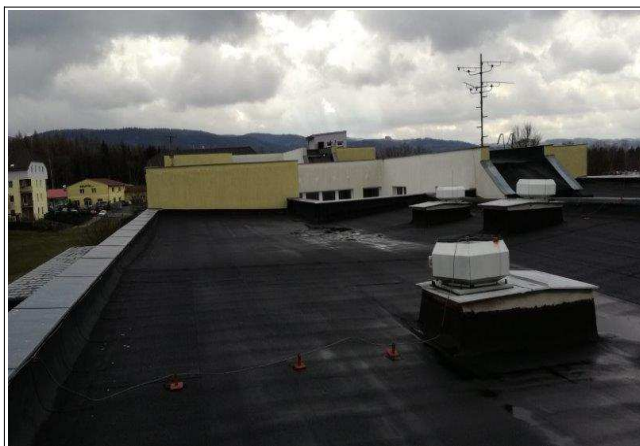
Foto /1/ Pohled na střešní roviny ze střechy č. 1

Stavba řeší opravu střechy základní školy. V minulosti již došlo k opravě dvou ze tří částí střechy. Projektová dokumentace je zaměřena na třetí část (střecha č. 1). Předmětem PD je obnova hydroizolační funkce střechy, zateplení střechy a navazující opravy.