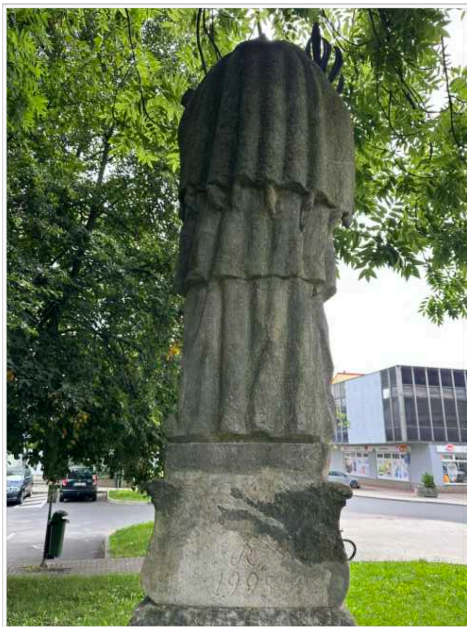
Foto č. 6. - Zadní strana sochy sv. Jana Nepomuckého, celoplošné znečištění povrchového zpracování pískovce zčernalými prachovými depozity a exhalacemi, vrchní část sochy světce, vodorovné partie jsou znečištěny mechy a lišejníky