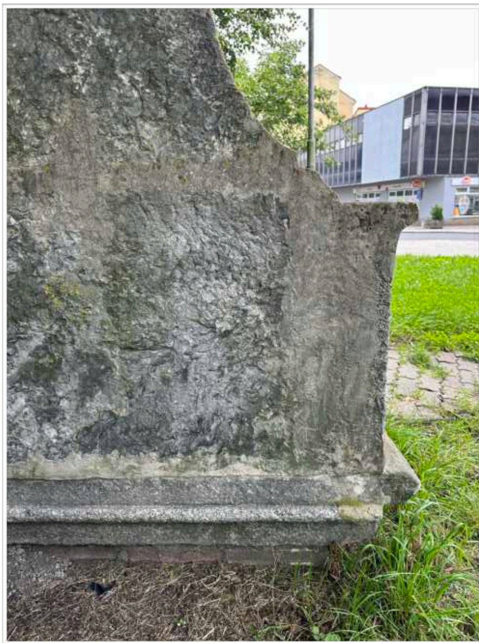
Foto č. 21. - Pohledově pravá strana základní části soklu na zadní straně, viditelné druhotné doplnění rozsáhlých partií, osazení základní části s reliéfem sv. Jana Nepomuckého na žulové profilované patce, zřejmě římsová část z původního umístění sochy a soklové architektury na mostě přes řeku Ohři