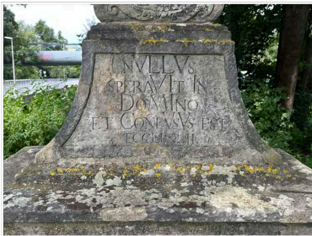
Foto č. 10. - Detail nápisového pole na přední straně nástavce soklové architektury s jemně vytaženým písmem, viditelné silné povrchové znečištění lemu zapuštěného zrcadla s nápisem