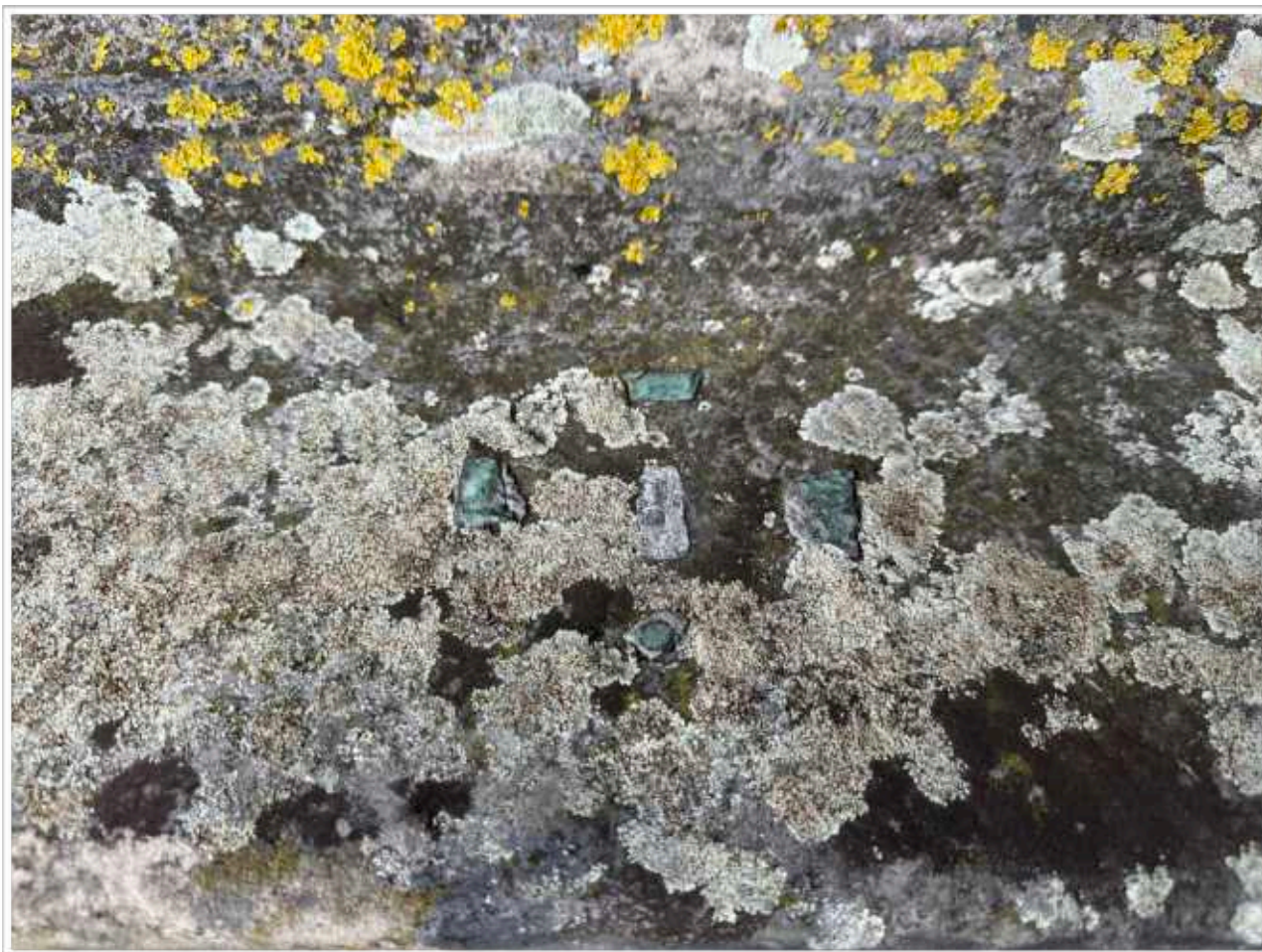
Foto č. 13. - Detail zaslepení, překrytí povrchu pískovcového materiálu mechy a lišejníky