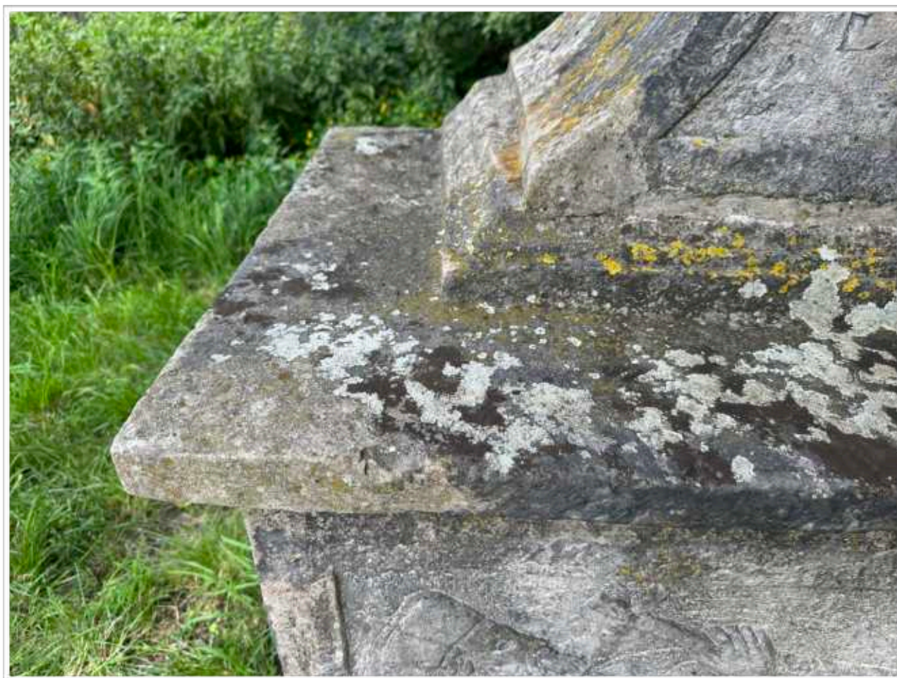
Foto č. 11. - Detail levého rohu spodní části soklové architektury, silné povrchové znečištění vodorovných ploch vrstvou mechů a lišejníků, druhotné doplnění rohu profilace