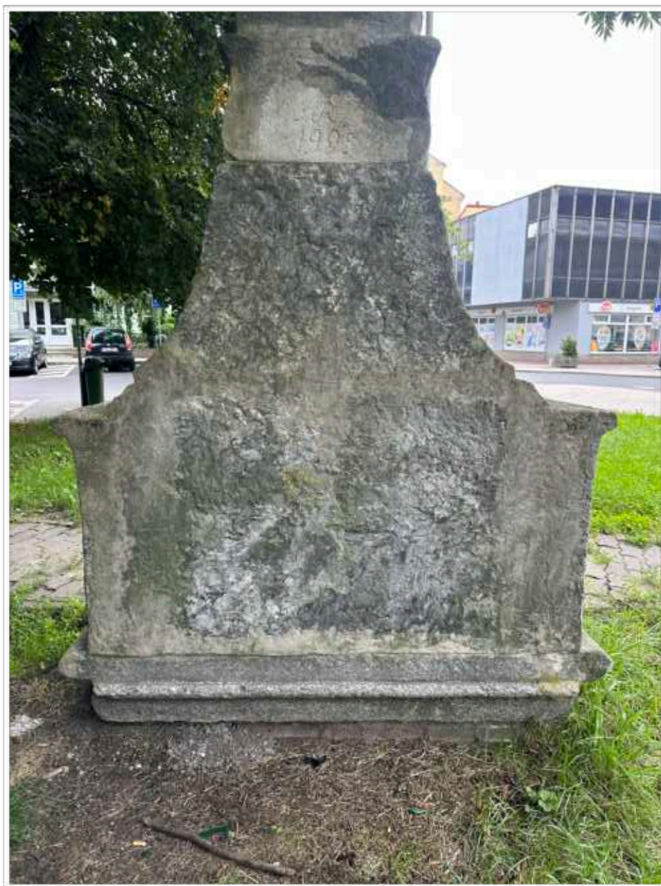
Foto č. 16. - Zadní strana soklové architektury, na vrchní části je vysekán nápis datace renovace 1995, spodní a středová část výrazně doplněna po obou stranách a v místech spárování jednotlivých částí architektury