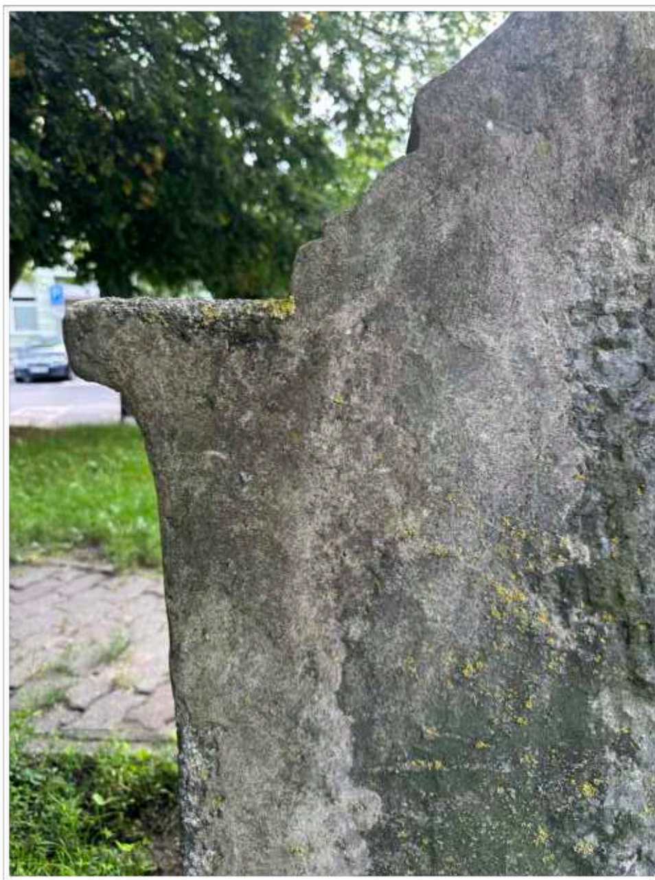
Foto č. 18. - Detail různorodého druhotného doplnění nerespektující původní reliéf zpracování povrchu zadní plochy soklu