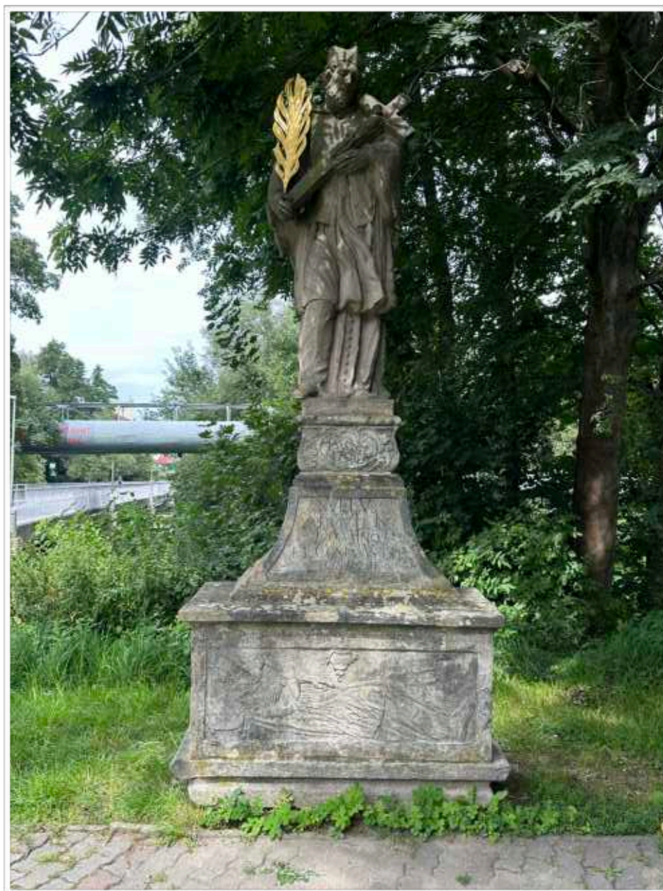
Foto č. 1. - Socha sv. Jana Nepomuckého umístěna na travnatém prostranství v ulici J. Kajetána Tyla, na povrchu je viditelné výrazné povrchové znečištění mechy a lišejníky zaslepující precizní zpracování modelace sochy světce a jemného reliéfu na přední straně spodní soklové části