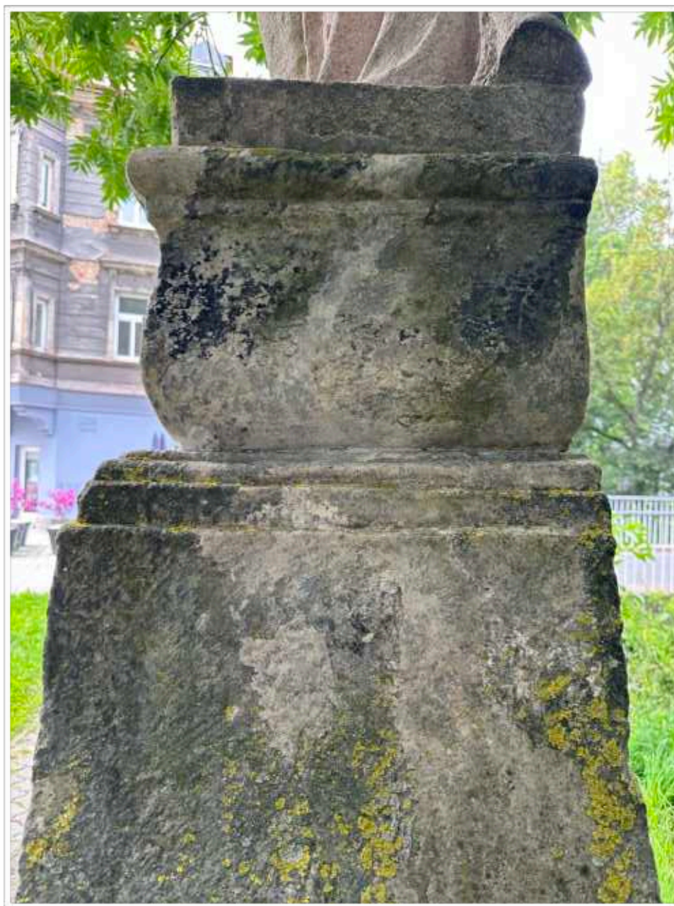
Foto č. 8. - Pohledově pravá strana soklové architektury, celoplošné znečištění pískovcového materiálu mechy a lišejníky kontrastující s druhotným doplněním a zčernalými depozity, druhotné doplňky nerespektují povrchové zpracování pískovcového materiálu