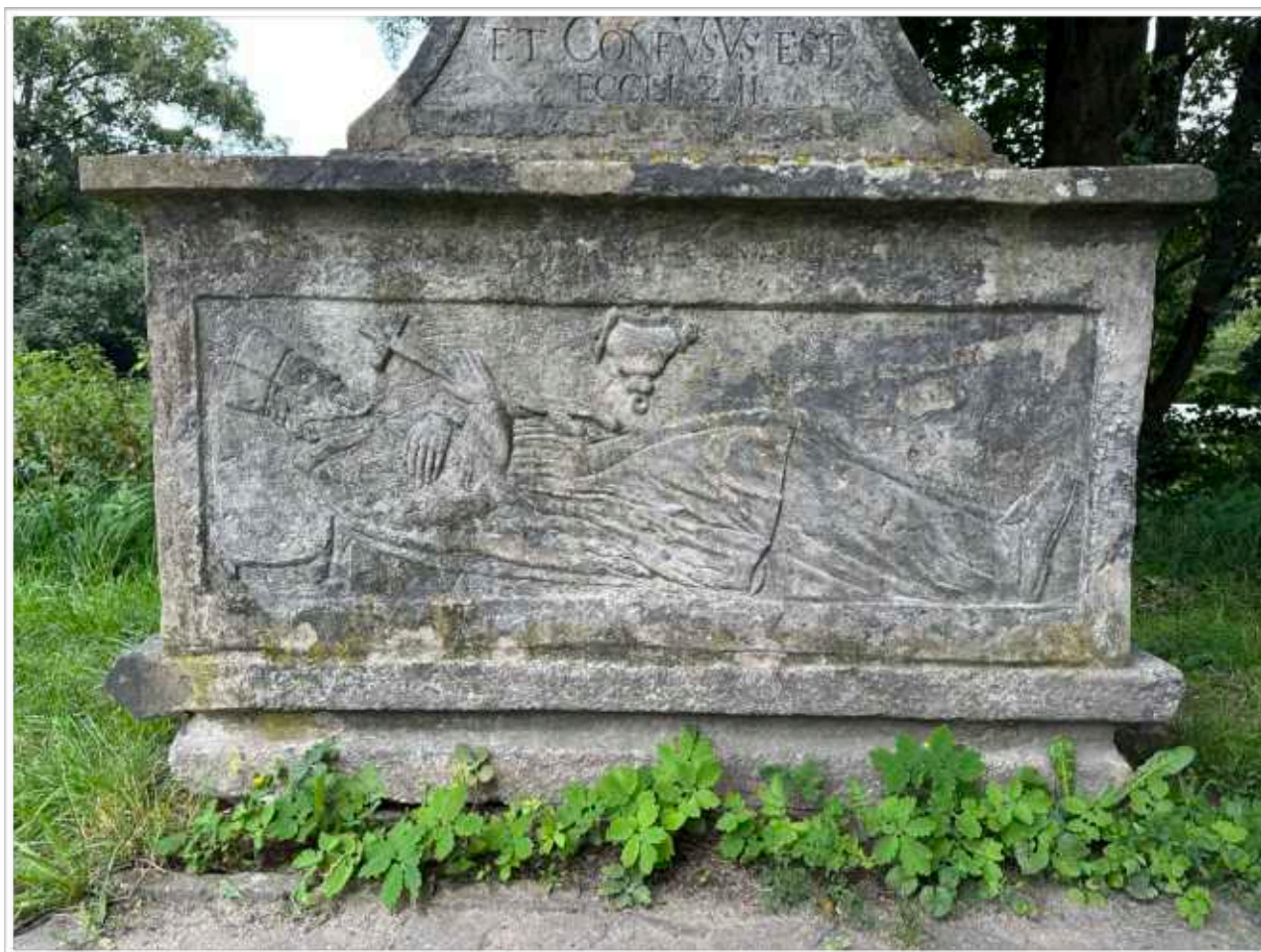
Foto č. 15. - Reliéf ležícího sv. Jana Npoemuckého, rozmanité povrchové znečištění jemného reliéfu