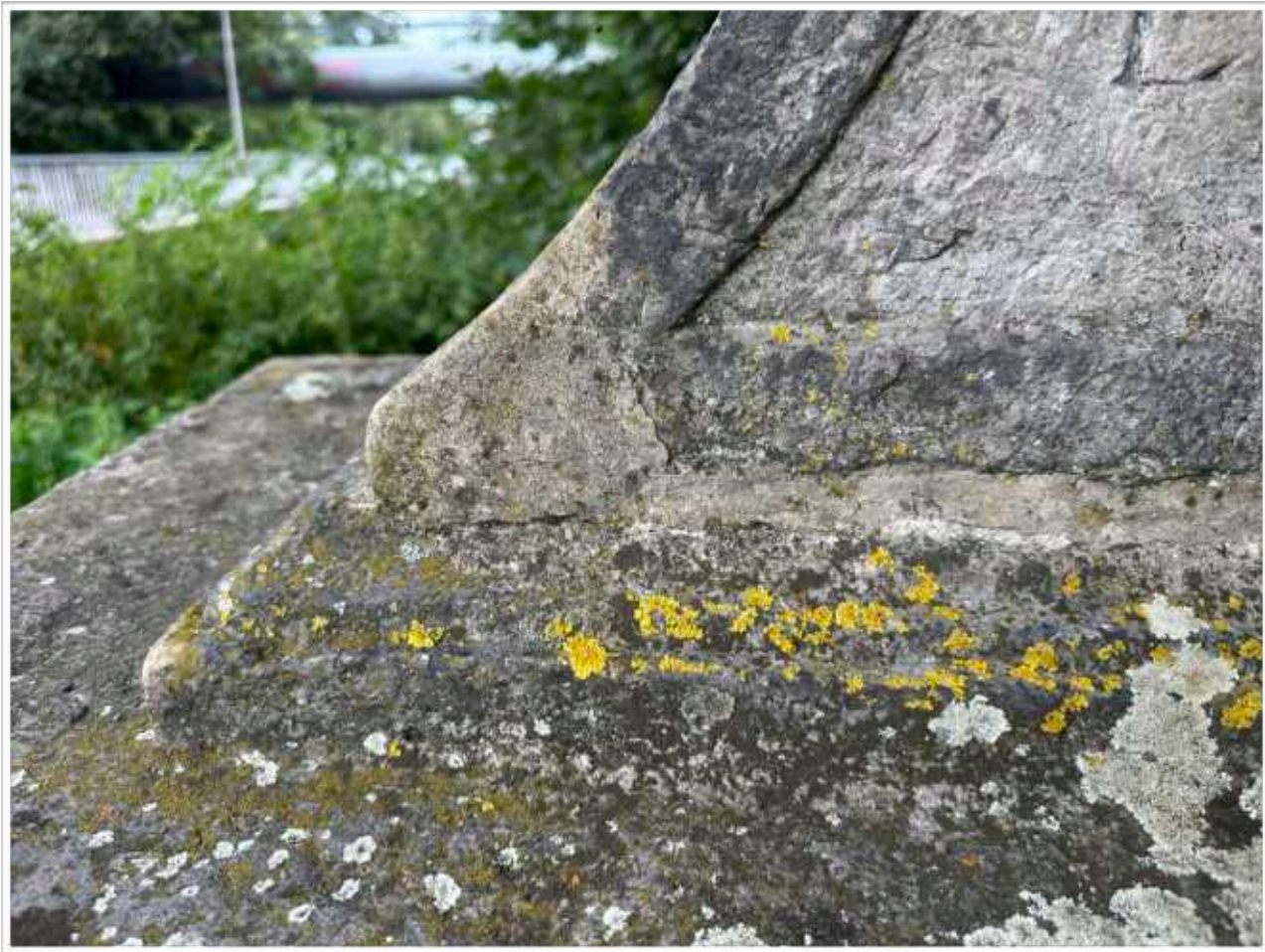
Foto č. 12. - Detail povrchového znečištění, druhotné doplnění a spárování soklové architektury