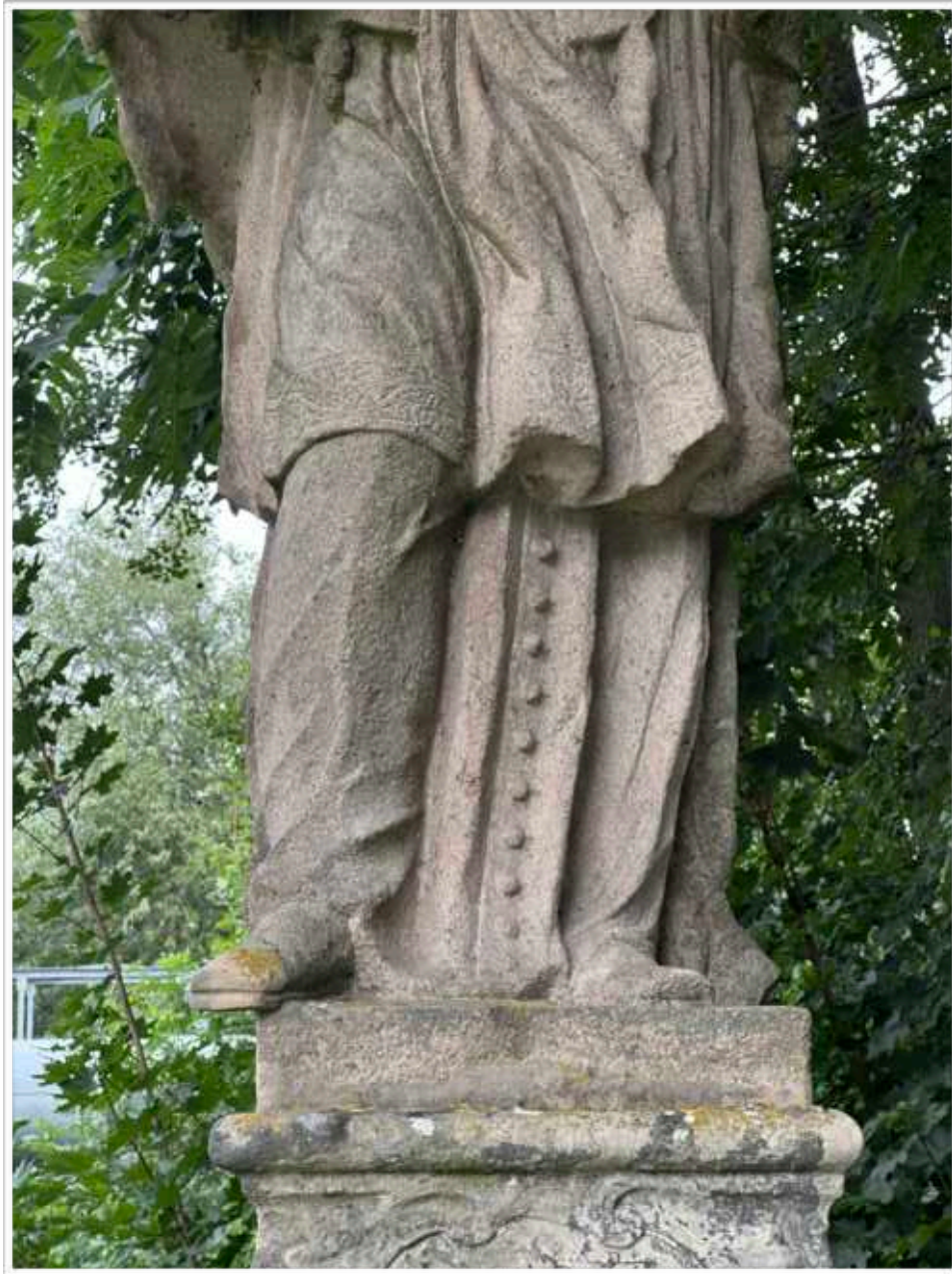
Foto č. 5. - Detail propracovaného krajkového lemu rochety, viditelné lokální znečištění spodní partie sochy světce jemně zčernalými prachovými depozity a exhalacemi tvořící neprodyšnou vrstvu