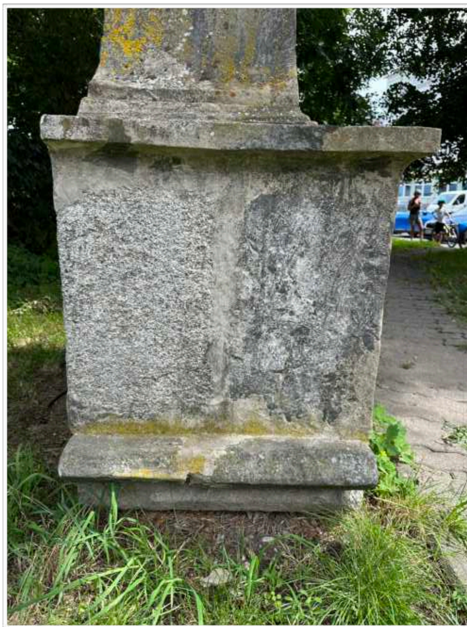
Foto č. 19. - Pohledově levá strana základní části soklové architektury s reliéfem sv. Jana Nepomuckého na přední straně