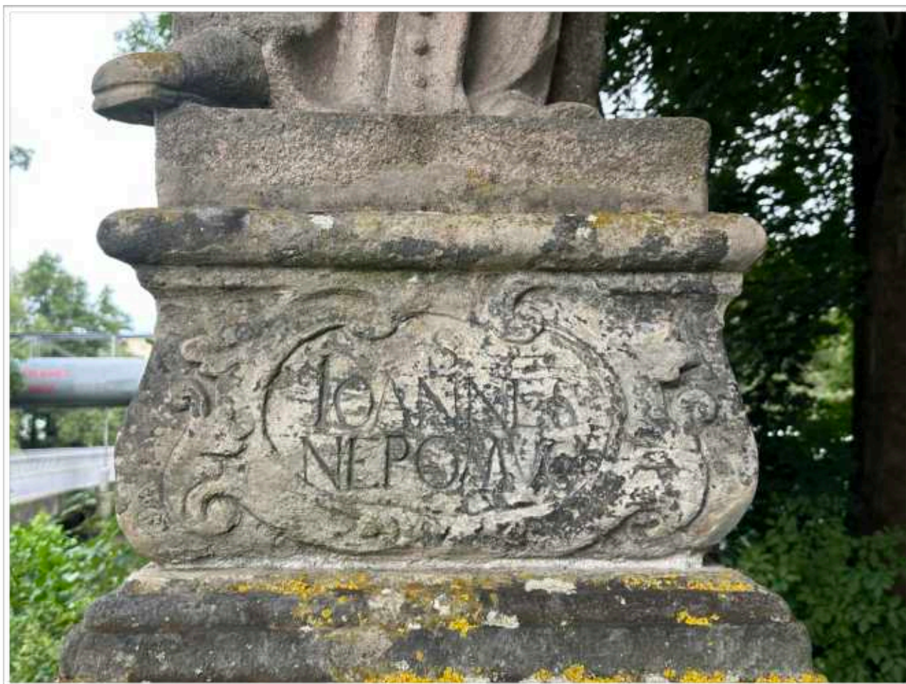
Foto č. 7. - Bohatě zdobená vrchní část soklové architektury s nápisovým polem v jemně zdobené kartuši s rozvilinami akantových listů, výrazné povrchové znečištění zčernalými depozity, kontrastující s druhotnými doplňky