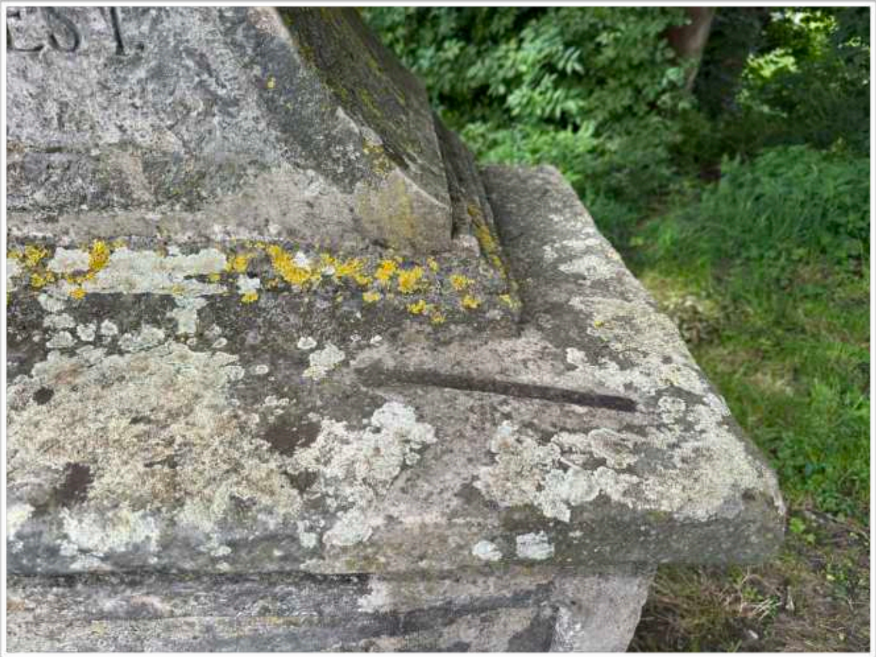
Foto č. 14. - Detail pohledově pravého rohu spodní části soklové architektury, silné povrchové znečištění vodorovných ploch vrstvou mechů a lišejníků, druhotné doplnění rohu profilace staženého železnou kramlí