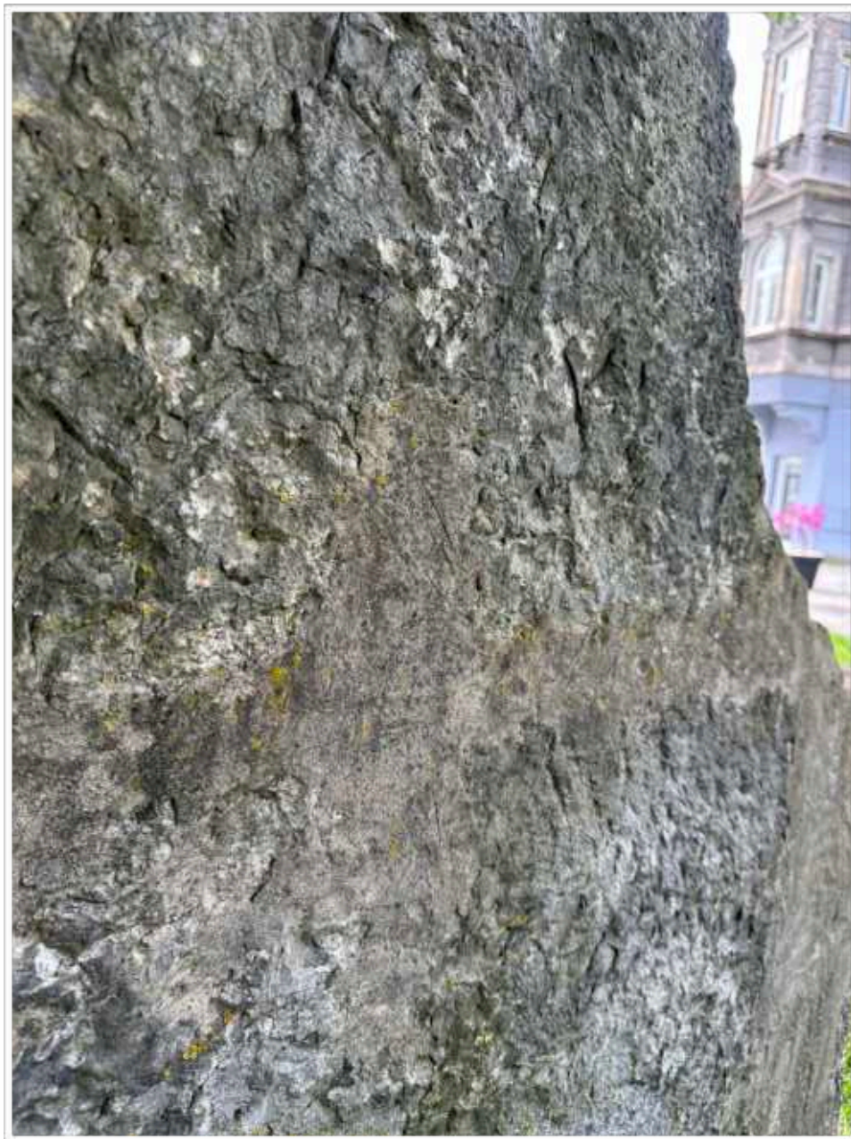
Foto č. 17. - Detail povrchového zpracování soklové architektury na zadní straně tvořící kontrast s druhotným doplněním plochy