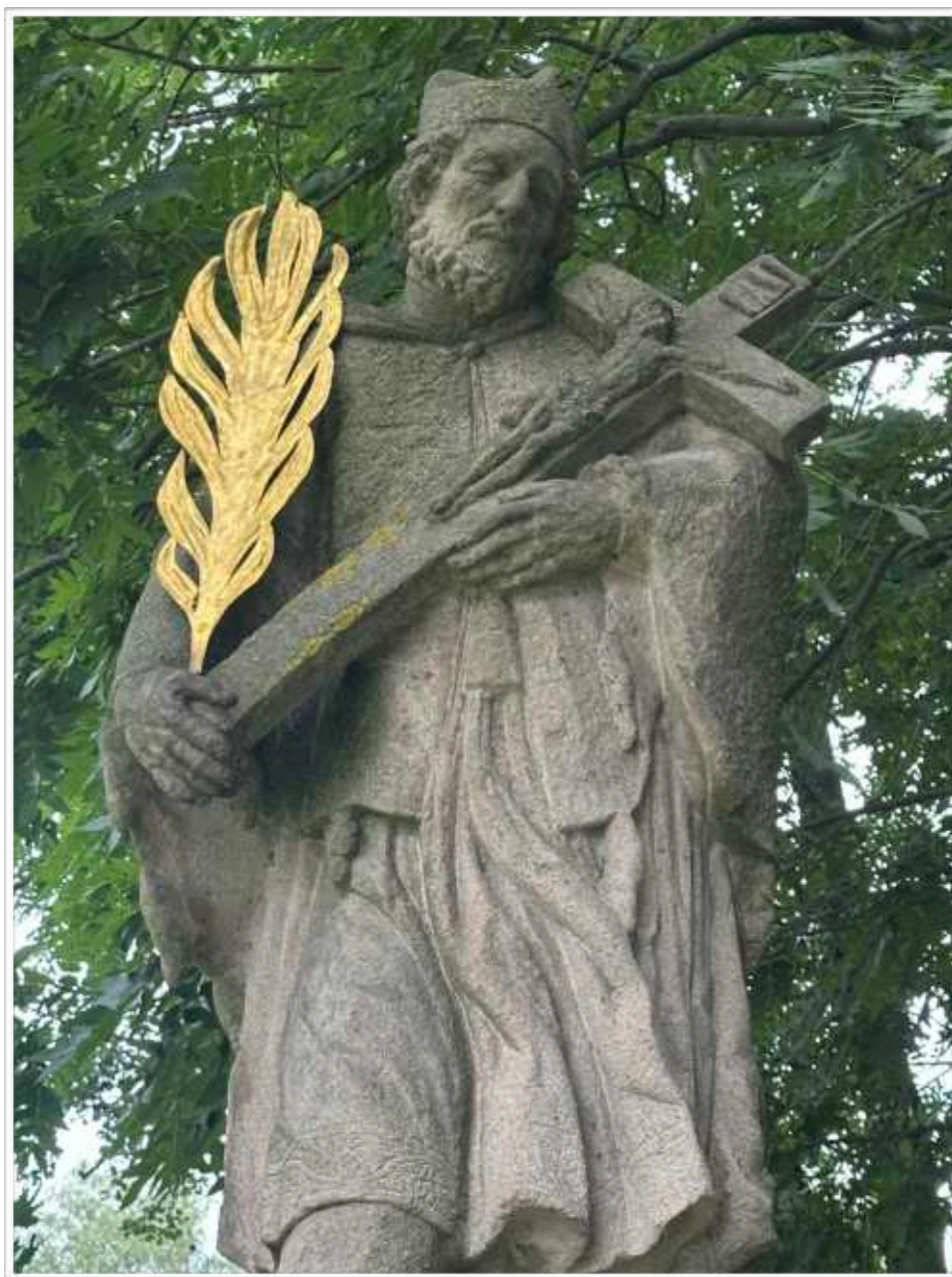
Foto č. 4. - Detail poprsí sochy světce, viditelné jemné gesto rukou přidržující kříž s korpusem Krista, detailní propracování barokní modelace drapérie almuce - kožešinového pláště a rochety- košile s krajkovým lemem