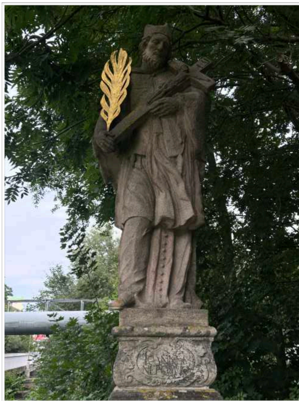
Foto č. 3. - Socha sv. Jana Nepomuckého, výrazné povrchové znečištění v důsledku umístění sochy v silně exponovaném prostředí pod vzrostlými stromy a nedaleké blízkosti frekventované pozemní komunikace