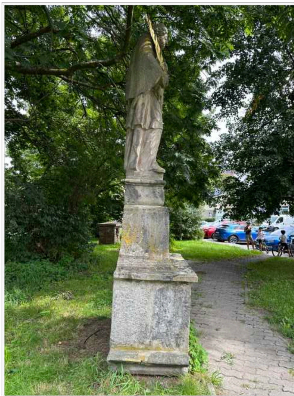
Foto č. 2. - Boční pohled na sochu sv. Jana Nepomuckého stojící na trojdílné bohatě profilované soklové architektuře, viditelné naklonění celé sochy spolu se soklovou částí, rozsáhlé druhotné doplnění soklové architektury nerespektující povrchové zpracování autentického materiálu