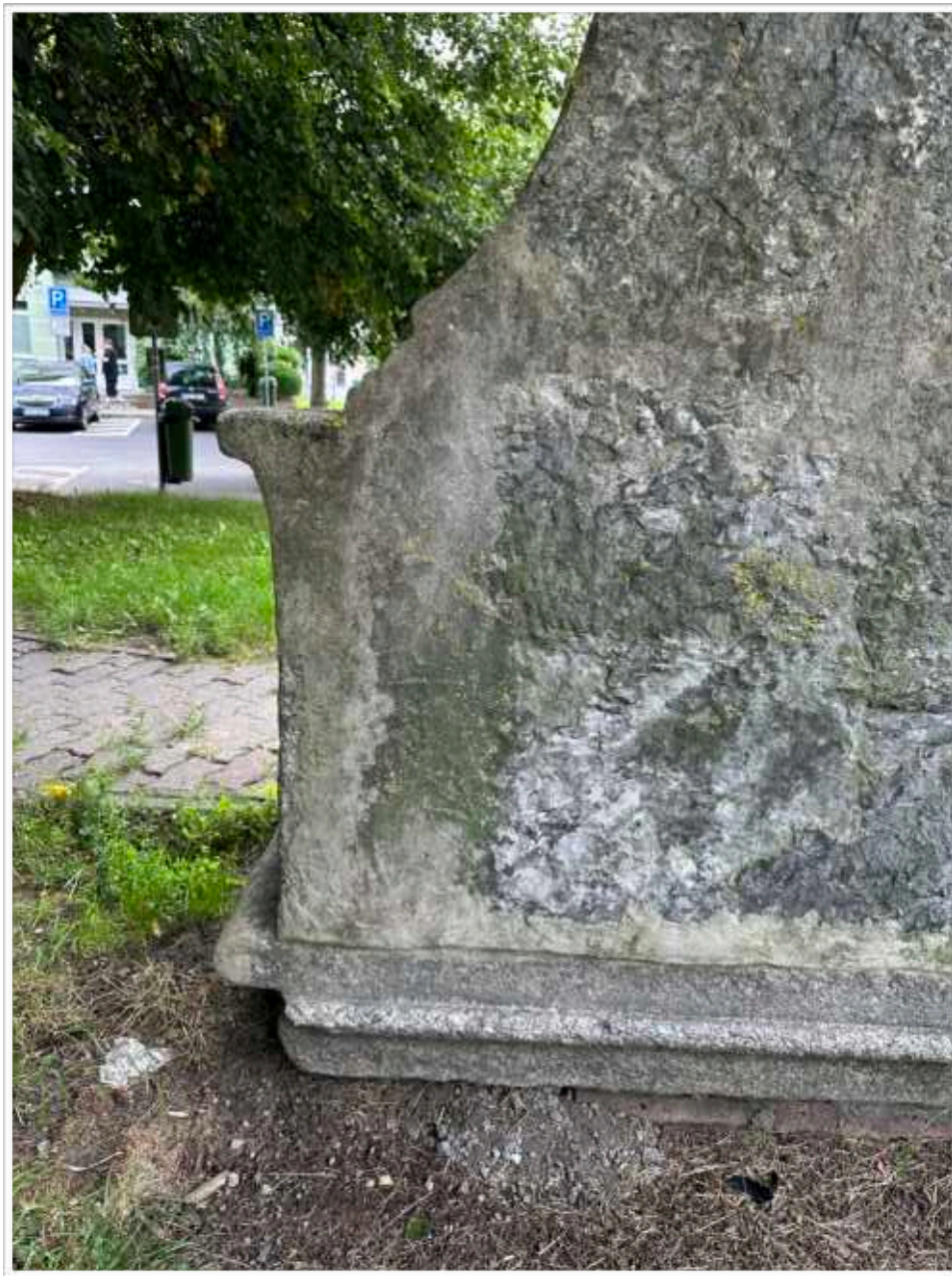
Foto č. 20. - Zadní strana soklu, pohledově levá část, druhotné doplnění rozsáhlých partií