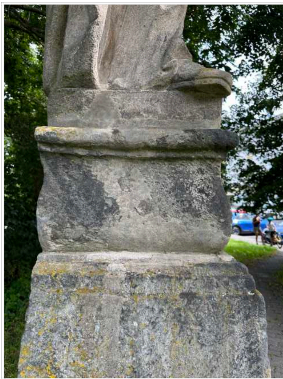
Foto č. 9. - Pohledově levá strana soklové architektury, celoplošné znečištění pískovcového materiálu mechy a lišejníky kontrastující s druhotným doplněním a zčernalými depozity, druhotné doplňky nerespektují povrchové zpracování pískovcového materiálu