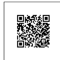
Zažádejte o vytyčení

Přílohy: Orientační zakres plynárenského zařízení, Detailní zakres plynárenského zařízení