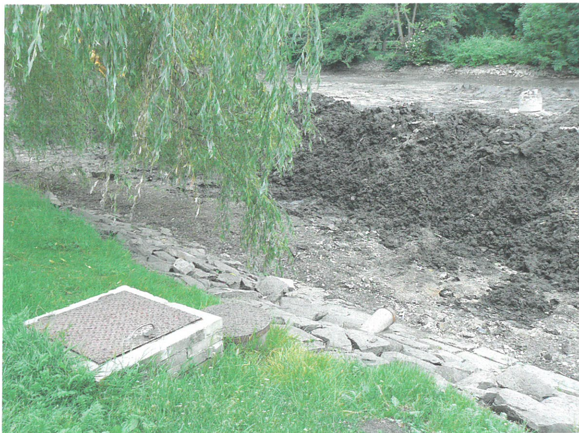
Dolní rybník, šachta a odběrné potrubí pro vodotrysk