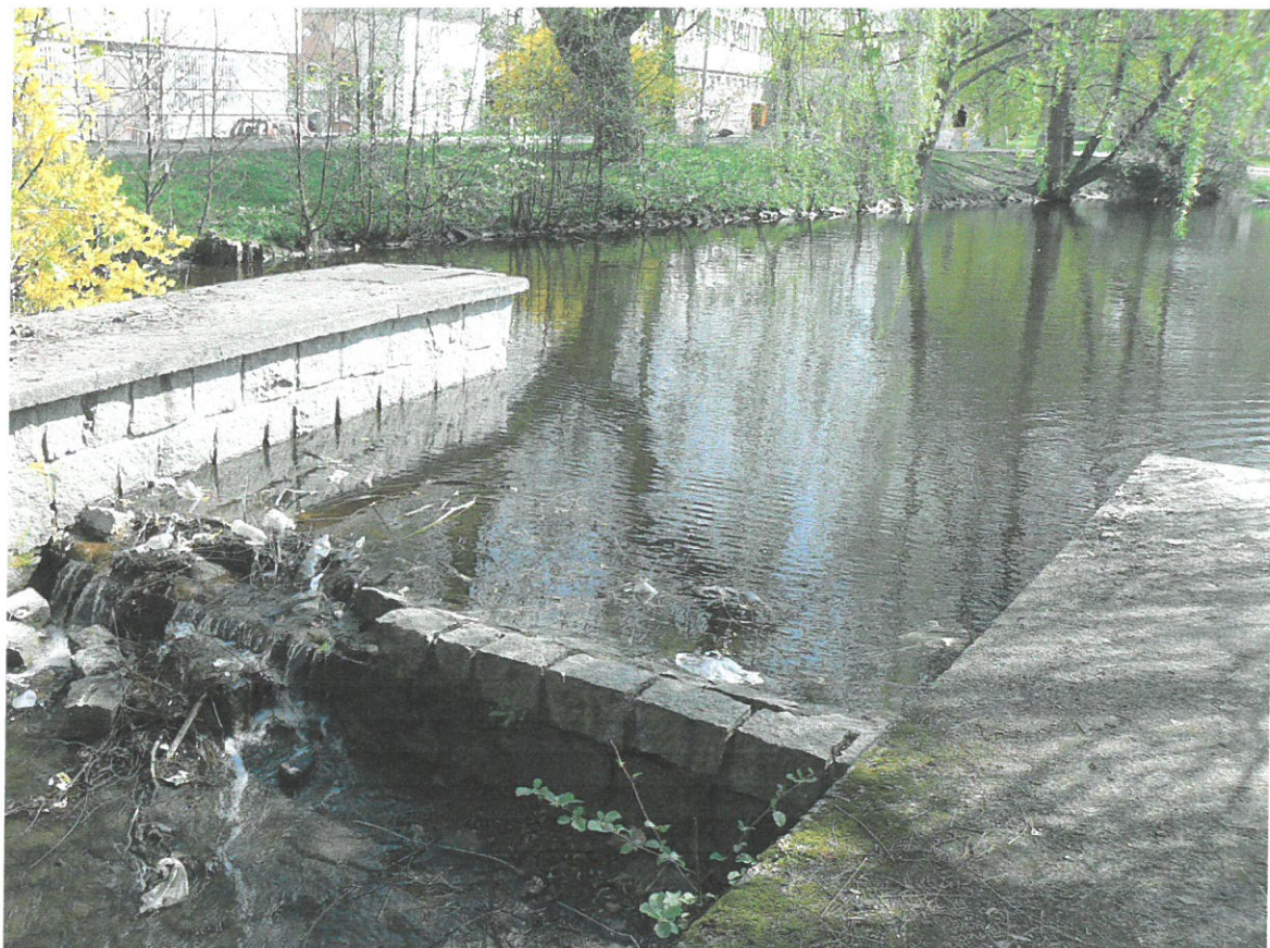
Dolní rybník, bezpečnostní přeliv před opravou 2009