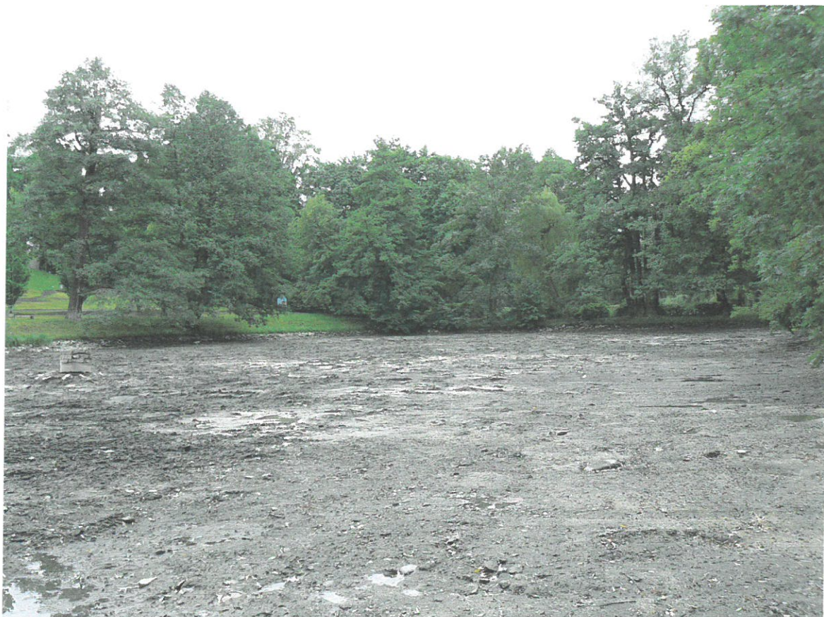
Dolní rybník, vypuštěný před odbahněním