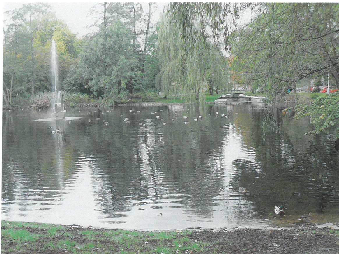
Dolní rybník po odbahněním a opravě funkčních objektů