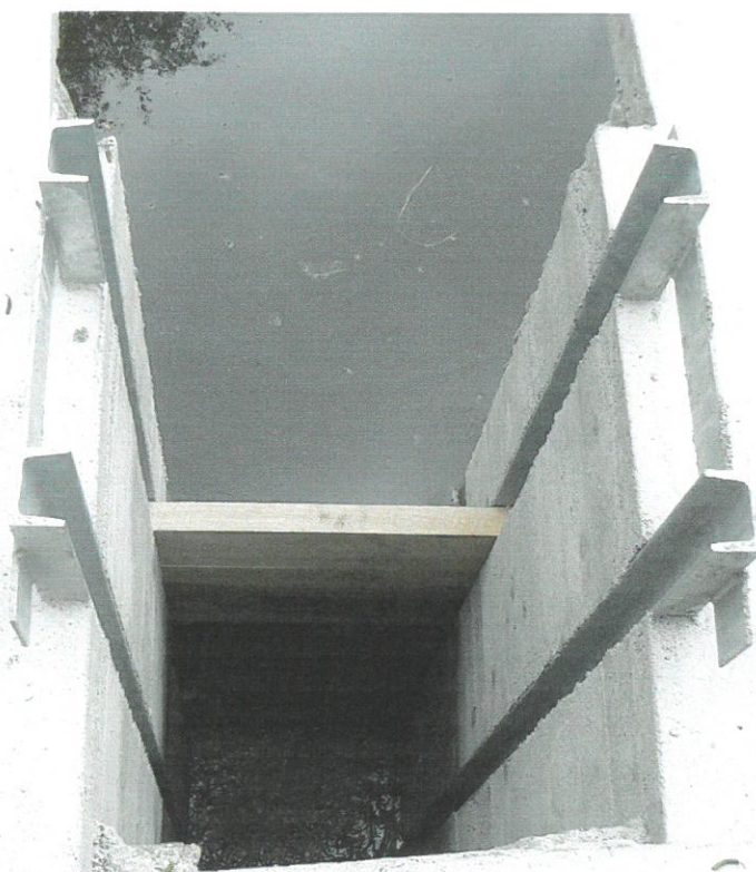
Dolní rybník, požerák -detail