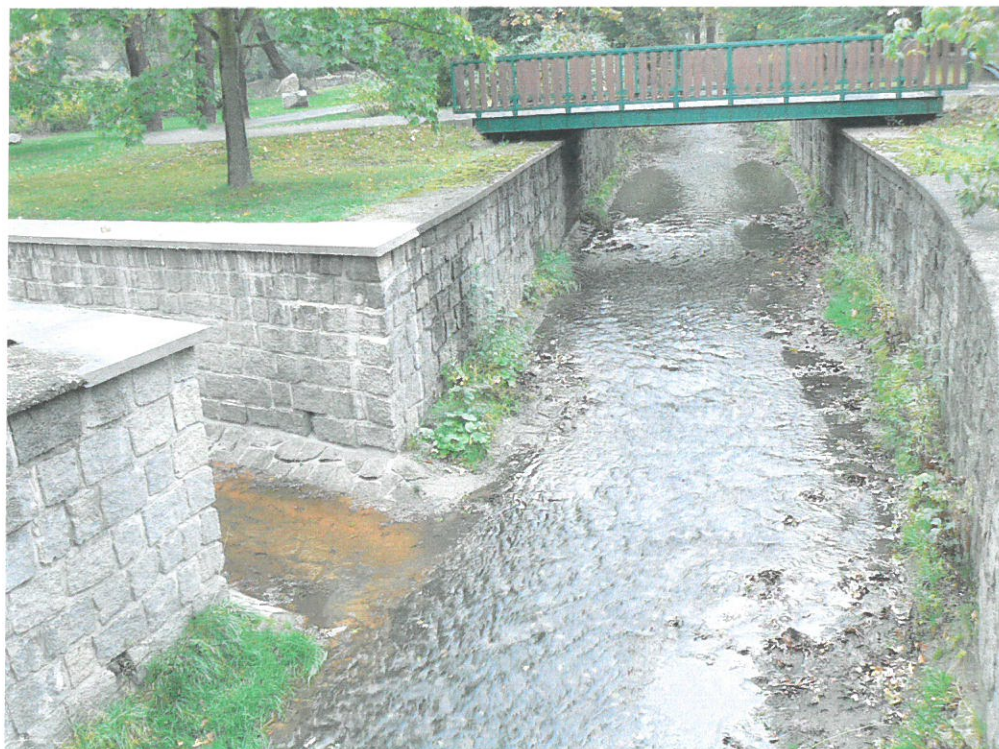
Výústění odtokového koryta do Lobežského potoka