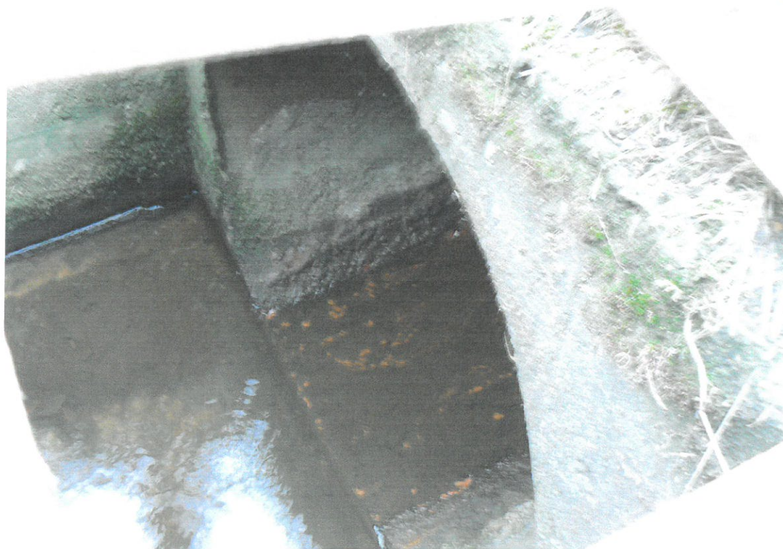
Detail odtokového potrubí DN 1000 z šachty Š 1 - poslední část zatrubněného úseku náhonu