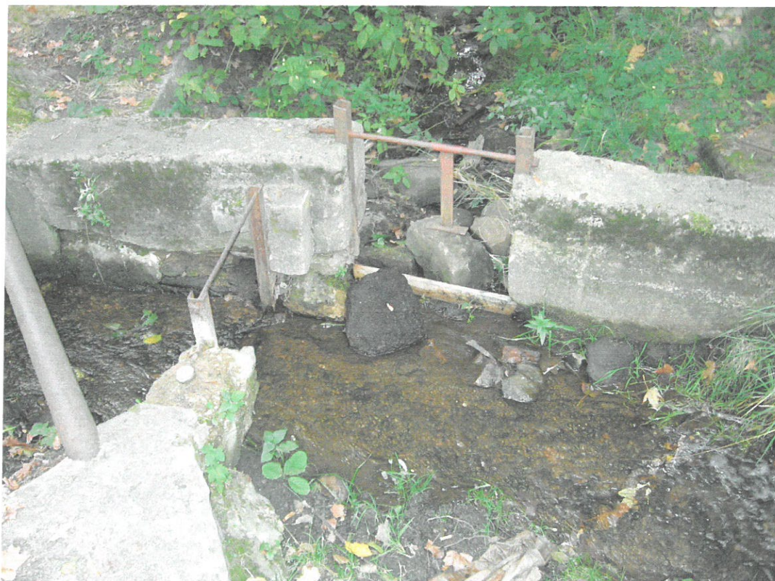
Detail rozdělovacího objektu