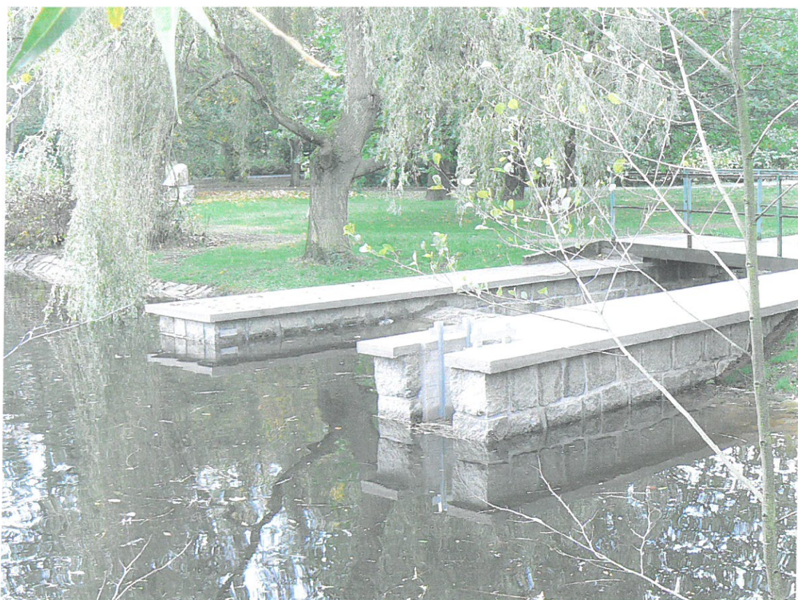
Dolní rybník výpustné objekty - požerák a bezpečnostní přeliv po opravě v r. 2009