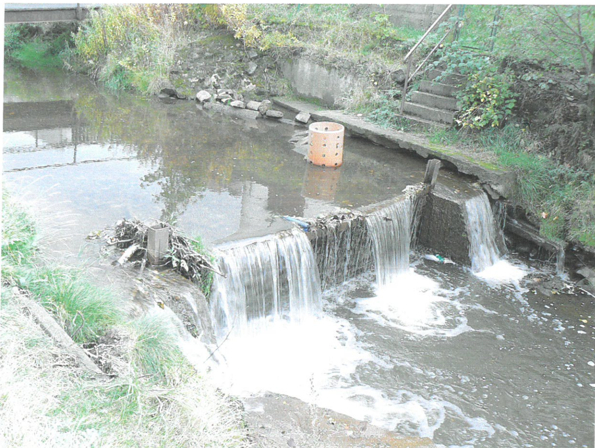
Jez na Lobežském potoce v ř.km 1,075 u budovy HZS