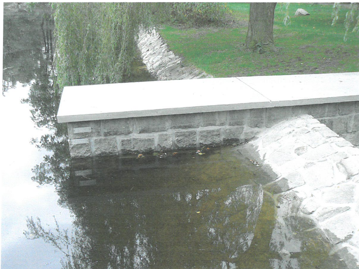
Dolní rybník, bezpečnostní přeliv, tabulky provozní a max.hladiny (po opravě 2009)