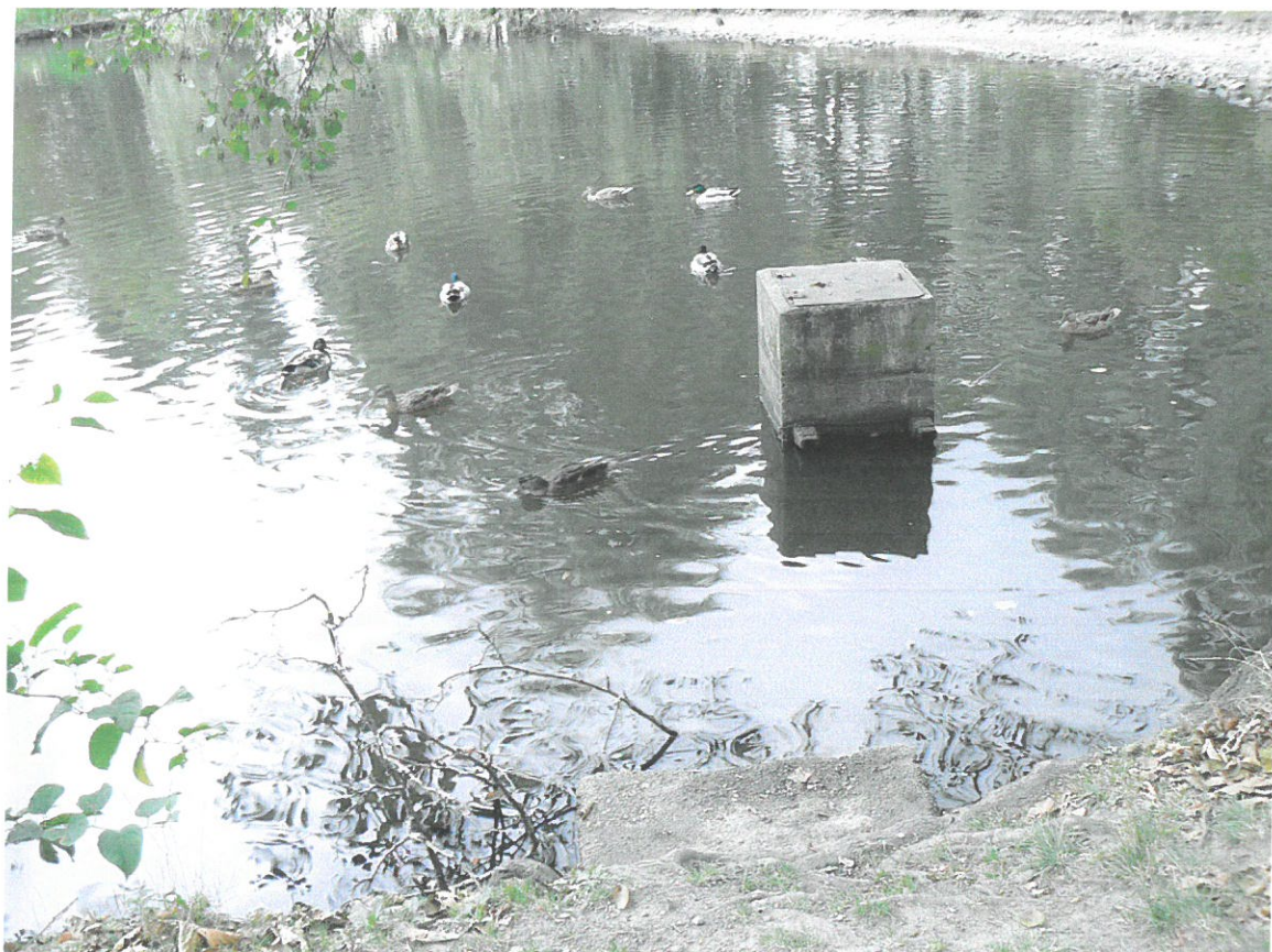
Horní rybník, vypouštěcí objekt (požerák) před opravou