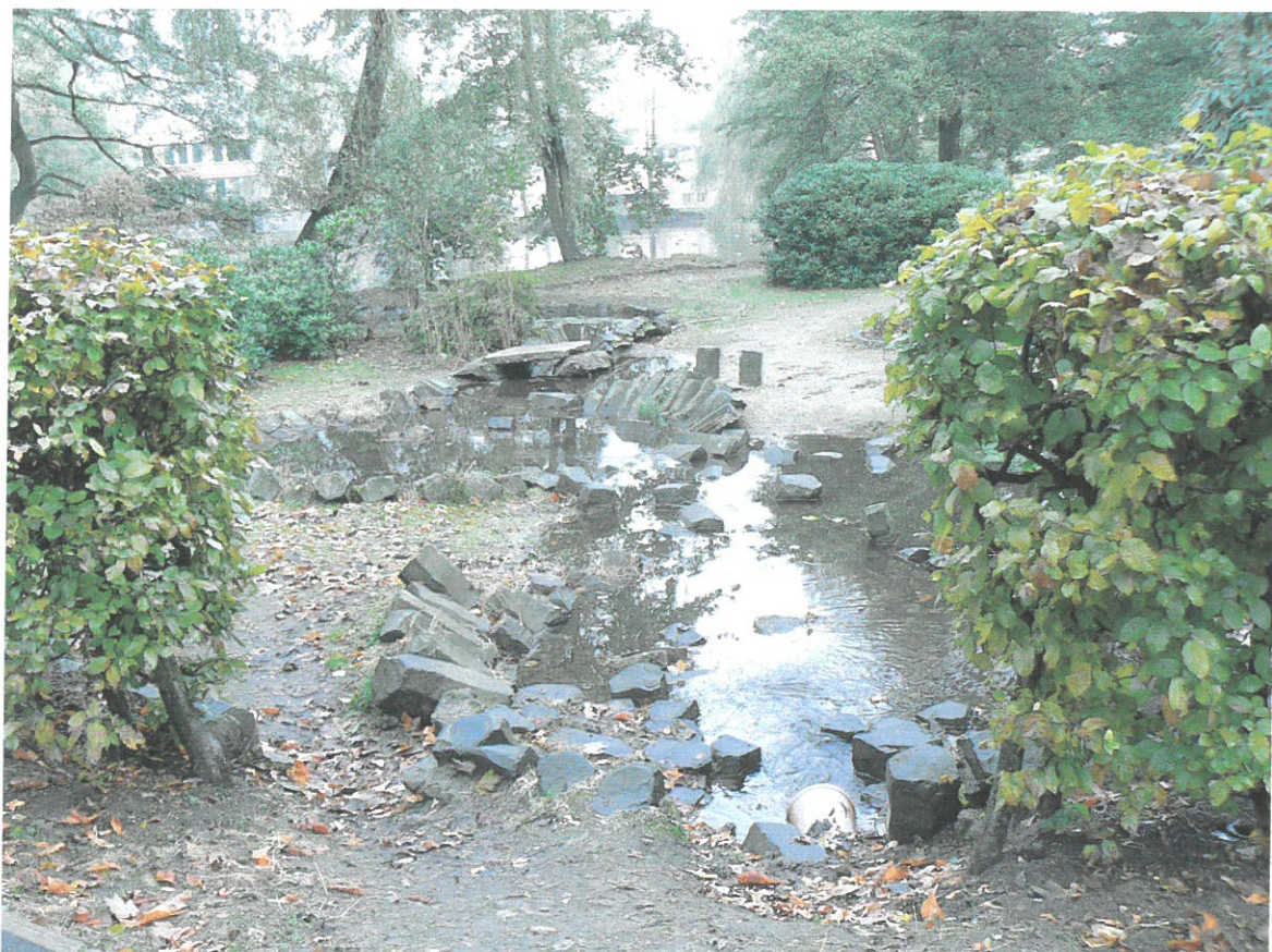
Napouštěcí potrubí a horní část Japonské zahrady