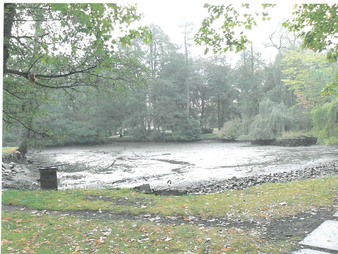
Horní rybník, vypuštěný před odbahněním