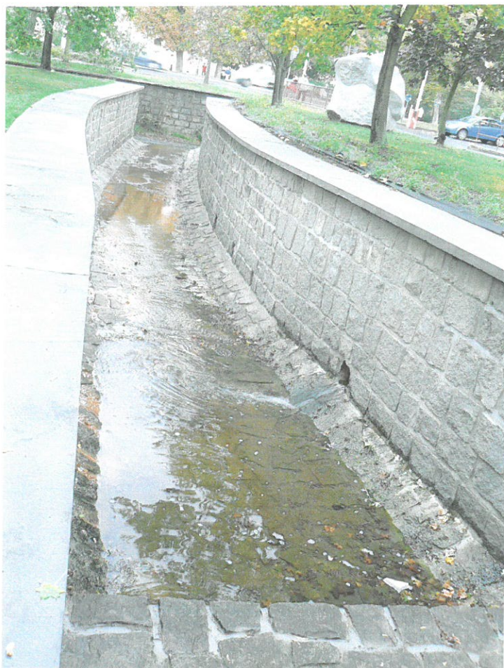
Dolní rybník, odtokové koryto výústění potrubí z požeráku (stav po opravě 2009)