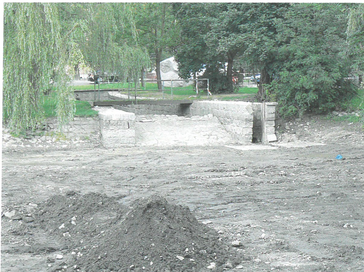
Dolní rybník při odbahnění a opravě přelivu, požeráku a odtokového kanálu 2009