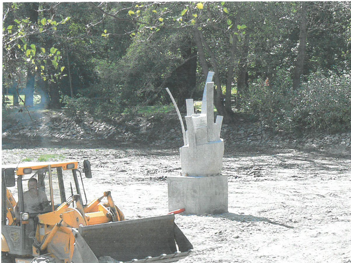
Dolní rybník, instalace vodotrysku po odbahnění vypuštěného rybníka 2009