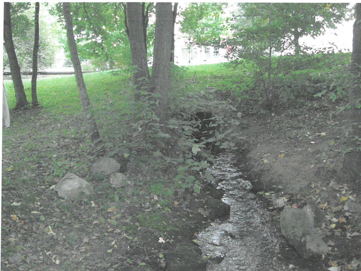
Horní část náhonu u zatrubněného úseku