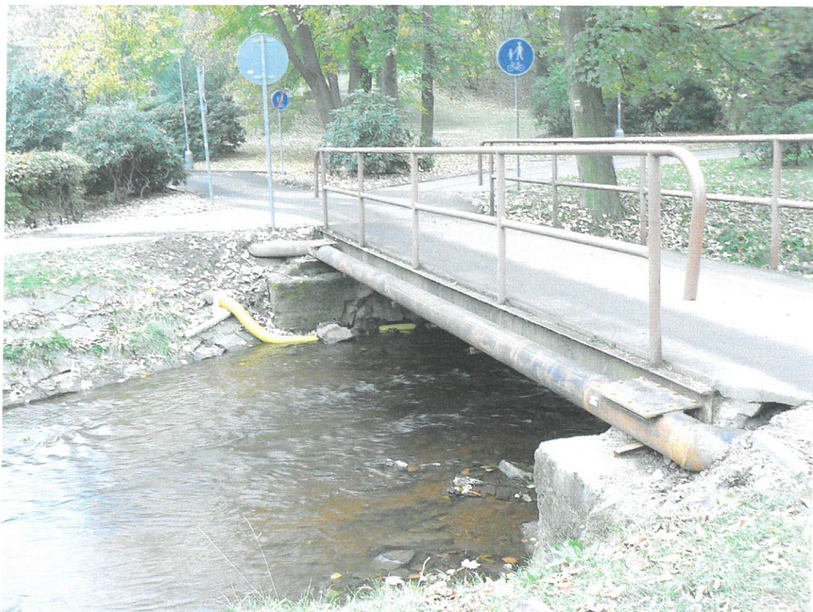
Nové propojení rybníků potrubím 200 DN s čistícími kusy