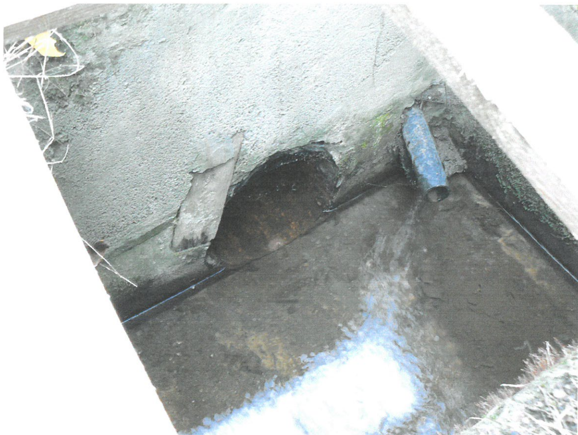
Šachta Š 1 v Husových sadech s potrubím přívodu vody od areálu HZS DN 400