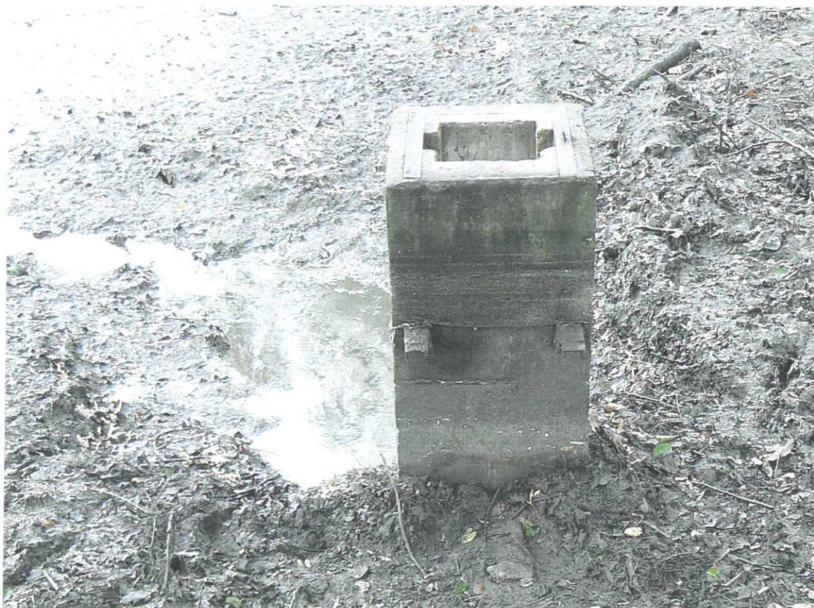
Vypuštěný Horní rybník, požerák před opravou a odbahněním rybníka