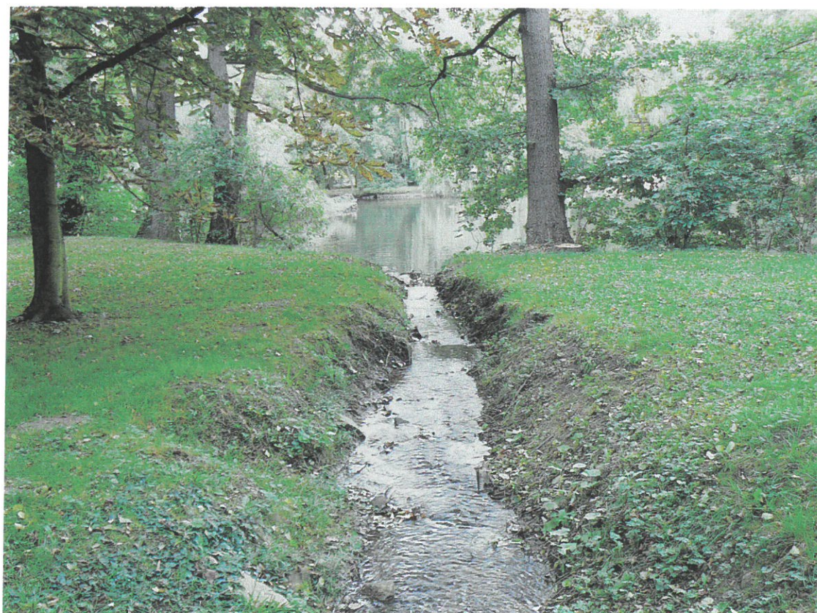
Dolní část napouštěcího koryta do Horního rybníka