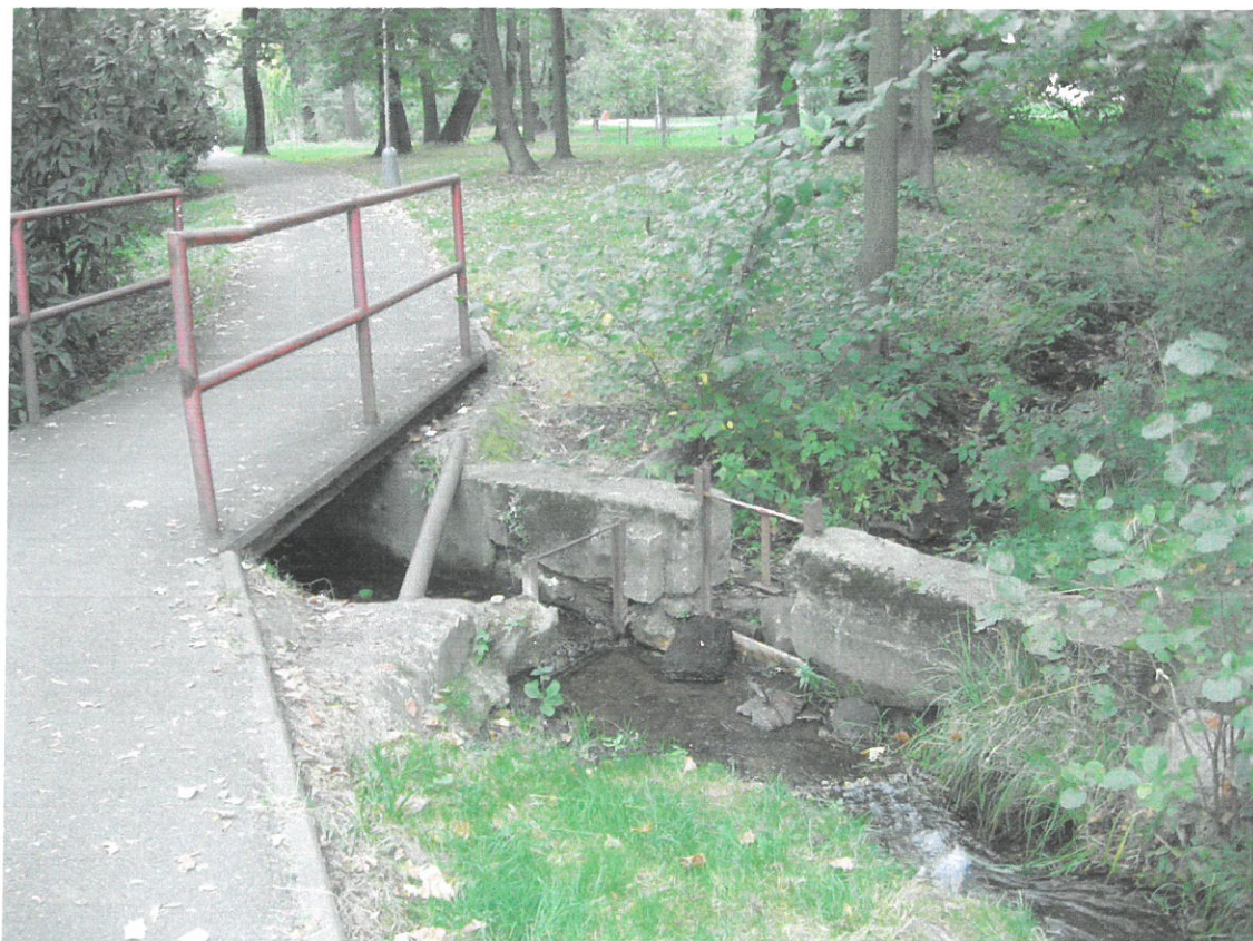
Rozdělovací objekt na náhonu do Horního rybníka