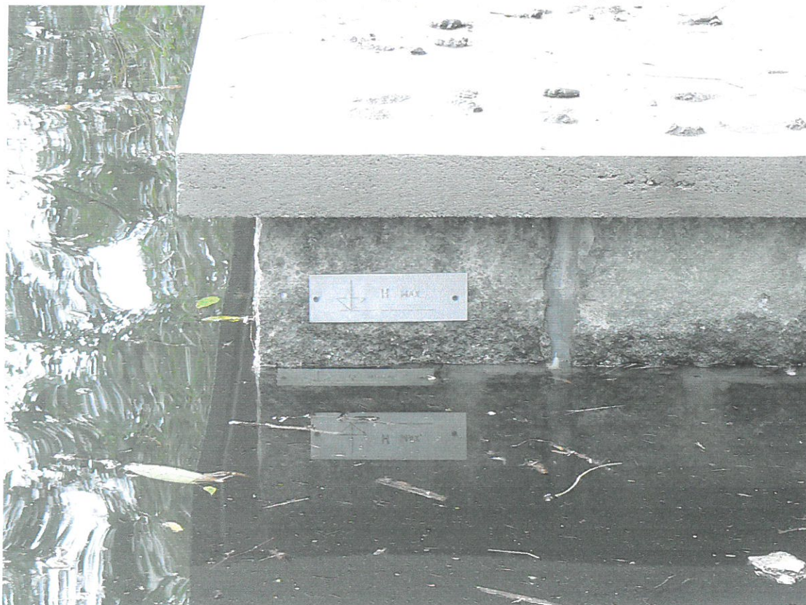
Dolní rybník, detail tabulky úrovně max. hladiny