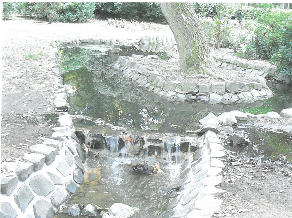
Jízek a dolní část Japonské zahrady